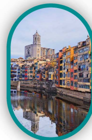
۴ شب بارسلون