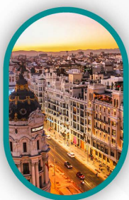
۳ شب مادرید