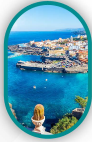
۴ شب ترفیف