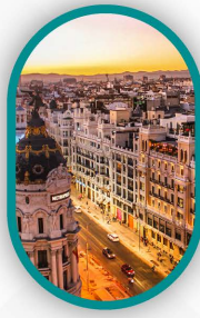
۳ شب مادرید