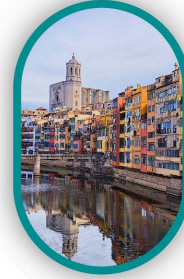
۴ شب بارسلون